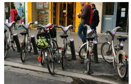
Posé sur un Vélib'

En conclusion, les stationnements vélo sont en nombre très insuffisant tant dans la rue du Commerce que dans les rues adjacentes. Les 2RM sont bien mieux lotis, d'autant plus que les motos n'ont pas besoin d'un support ou même d'être accrochées, ce qui évidemment n'est pas le cas des bicyclettes.