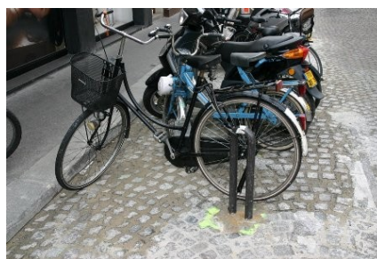
Attaché à un arceau 2RM