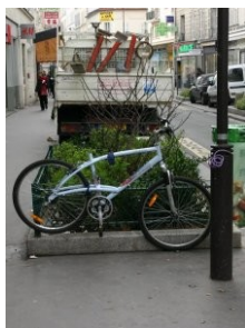
Fixé à une jardinière

Quelques photos illustrant la débrouille des cyclistes rue du Commerce :